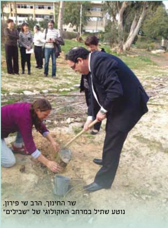
שר החינוך, הרב שי פירון, נוטע שתיל במרחב האקולוגי של "שבילים"