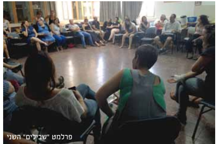
פרלמט "שבילים" השני

אני חושבת שיש חשיבות רבה בהעברת סדנא שכזו בשבילים היות ומדובר בסטודנטים (לחלקם זו הפעם הראשונה שהם עומדים בפני סיטואציה כזו) שהבחינות מהוות עבורם מצב לחץ שאינו מאפשר להם לעבור את תקופת המבחנים בצורה מיטבית. מעבר לכך, הערך המוסף הינו שסדנא כזו יכולה לעזור לכם כאנשי חינוך לאתר תלמידים הלוקים בחרדת בחינות ולהציע להם פתרונות להתמודדות.