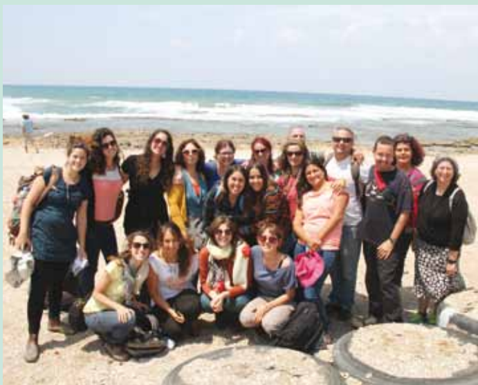
ביקור בג'אסר אזרקה בקורס תצורת פדגוגיות עם רביב