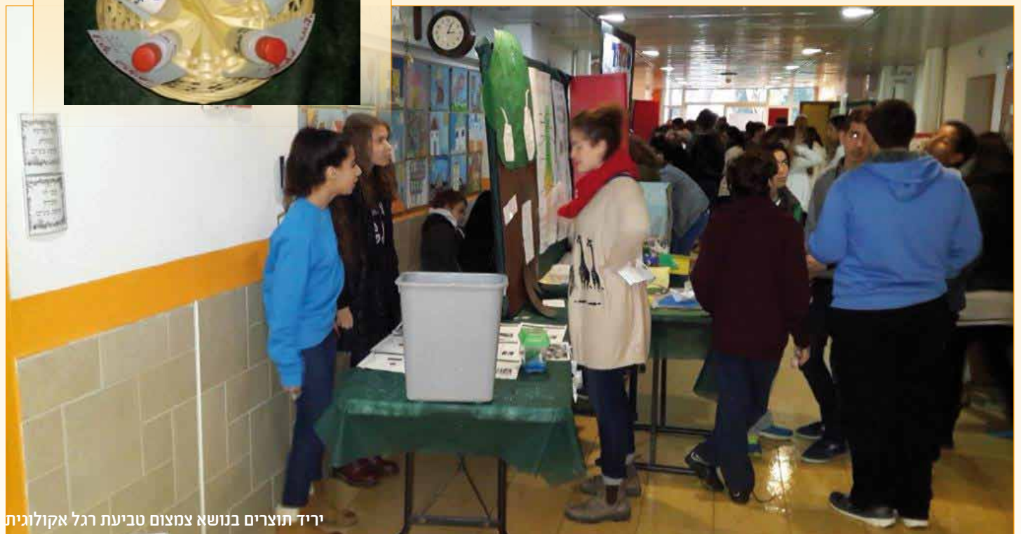
יריד תוצרים בנושא צמצום טביעת רגל אקולוגית