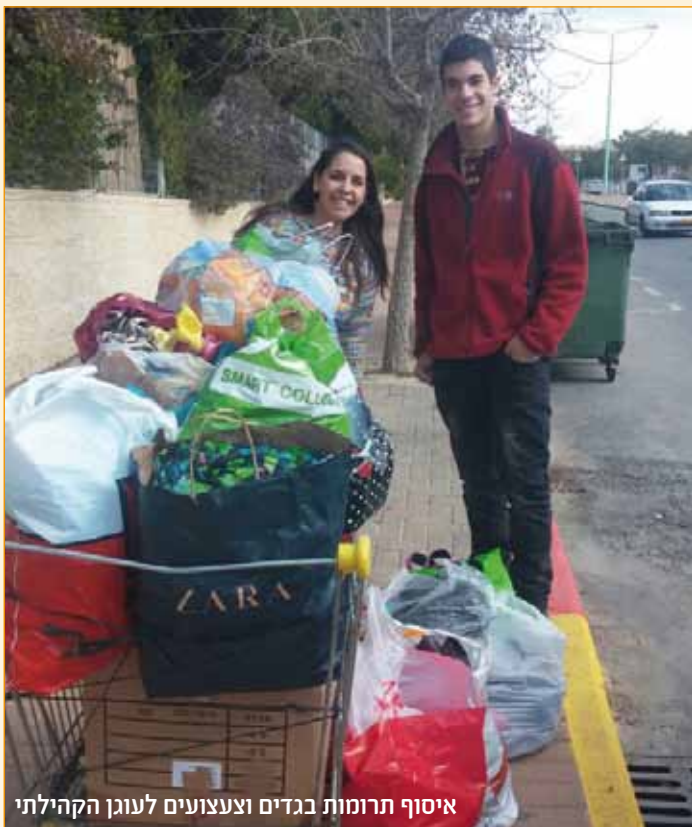
איסוף תרומות בגדים וצעצועים לעונג הקהילתי

לפני כחודש התקיימה בבית ספרנו פעילות במסגרת המקצוע גאוגרפיה על ההתחממות הגלובלית. במהלך הפעילות, התבקשנו להתחלק לקבוצות ועל כל קבוצה היה לבחור נושא אותו תחקור הקשור להתחממות הגלובלית. לאחר שהתחלקנו לקבוצות, התחלנו לעבוד. העבודה התחלקה לשני חלקים - עבודה יצירתית ועבודה כתובה (מצגת, פלקט). זו היתה חוויה מיוחדת ושונה שבמהלכה גם נהנו ויצאנו קצת משגרת הלימודים הקבועה וגם למדנו דברים רבים וחדשים. בנוסף לכך חידדנו את יכולות המחקר שלנו ואת עבודת הצוות. את התוצרים שיצאו בסופו של דבר, הצגנו פה בתערוכה בבית הספר, התערוכה הייתה מקסימה ובאמצעות העבודות של חברנו למדנו דברים נוספים. לסיום, הפעילות היתה חוויה מיוחדת ושונה, מאוד נהננו במהלכה!