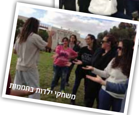
משחקי ילדות בחממות

כל הדיך הם לחוק אני לא התנצלתי פשוט נרדמתי שם והיא האורה היא לא זיכרון ולא אחק שפתיים