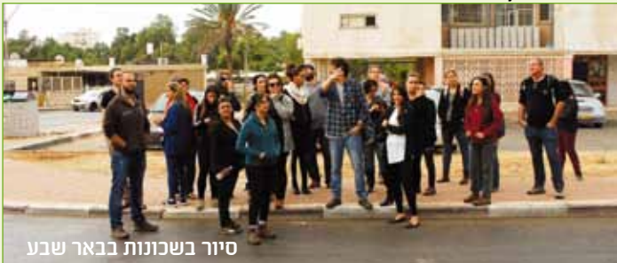
סיור בשכונת בבאר שבע

שבילים - מסלול לחינוך פוליטי ?! מסלול המכשיר אנשי חינוך לעסוק בפורמאלי ובבלתי פורמאלי , בחינוך חברתי ובקיימות, בהתבוננות גלובאלית על העולם דרך משקפי מקצועות הגיאוגרפיה, תוך הורקה משמעותית של עקרונות החינוך הדמוקרטי אל תוך הוריד ועידוד לפעילות בקהילה - אז תגידו אתם...אנחנו פוליטיים או לא ?!