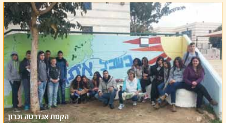
הקמת אנדרטה זכרון

שילוב הסטודנטים בכיתות יצר למידה מסוג אחר אצל התלמידים, הסטודנטים חשפו את התלמידים לרבדים השונים של הנושא והתלמידים בחרו נושאים שמעניינים אותם וחקרו אותם בקבוצות קטנות. חקירת הנושא לעומק והאפשרות ליצור תוצר, יצרה אצל התלמידים מוטיבציה לימודית מסוג אחר. בסיום הלמידה התלמידים בהכוננת הסטודנטים ערכו תערוכת מוצגים ועבודות בנושא אשר מטרתה לתת ביטוי לשאלות שנשאלו במשך הלמידה, הורים וצוות ביה"ס הוזמנו לתערוכה שקצרה שבחים רבים. ביה"ס אשל - הנשיא מעריך את עבודתם והשקעתם של הסטודנטים והצוות המלווה ורואה ברכה בשיתוף הפעולה הפורה שתורם להעשרת התלמידים ולחוויה לימודית משמעותית בקרב התלמידים.