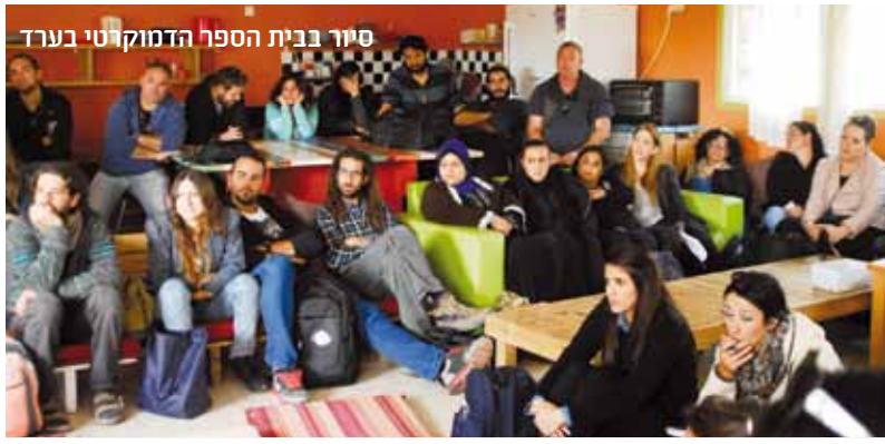
סיור בבית הספר הדמוקרטי בערד

מסר לסטודנטים: יש לכם הזדמנות לצמיחה תנצלו אותה