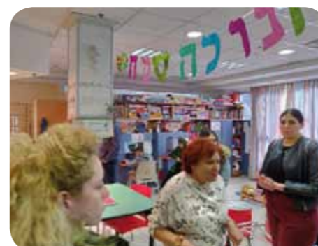
ביה"ח השיקומי אלי"ן

המשכנו ל"מרכז שלוה" האופטימי והקסום. המקום נוסד על בסיס האמונה כי האחריות לילדים עם מוגבלויות אינה רק של המשפחה שבה נולדו. המשפחות זקוקות וראויות לתמיכת הקהילה.