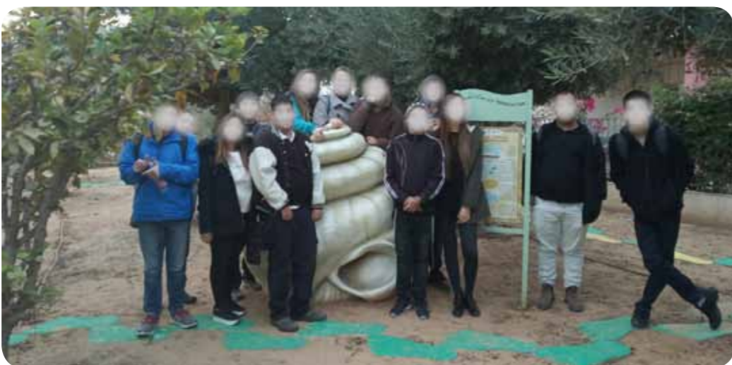
ביקור האקדמיה החברתית של מכללת קיי בשביל הביומימיקרי

בשנים 2016-2018 למדו הסטודנטים השייכים לתוכנית רג"ב (ראש גדול בהוראה) במכללת קיי קורס בנושא ביומימיקרי. התהליך החל מלימוד על הנושא והמשיך בקיום ימי שיא בתוך המכללה ומחוצה לה, כאשר שיא הפעילות היה בחניכת שביל הביומימיקרי שבכותלי המכללה.