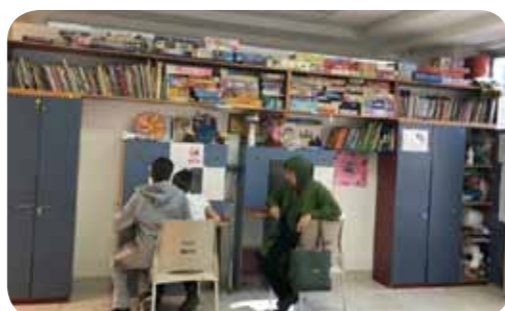
מרכז פעילות לילדים מאושפדים בבית החולים "אלי"ן."