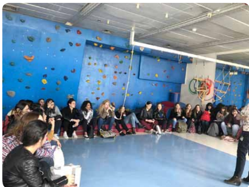
שיחת סיכום ופרידה בבית החולים "אלי"ן."

כיאה לחג החנוכה, חג האורות, סיורנו הציג שני מקומות המהווים אור גדול בתחום קבלת השונה והחינוך המיוחד בישראל. המדינה לא מצויה "בחושך" בנושא שילוב אוכלוסיות בעלי צרכים מיוחדים! ישנן נקודות אור גדולות שמאירות ומפיצות את בשורתן כי כל אדם יכול להתפתח ולהתקדם. מרכזים אלה הם ההוכחה הניצחת לכך שעם הקשבה רבה לאדם – ניתן להאיר חייו.