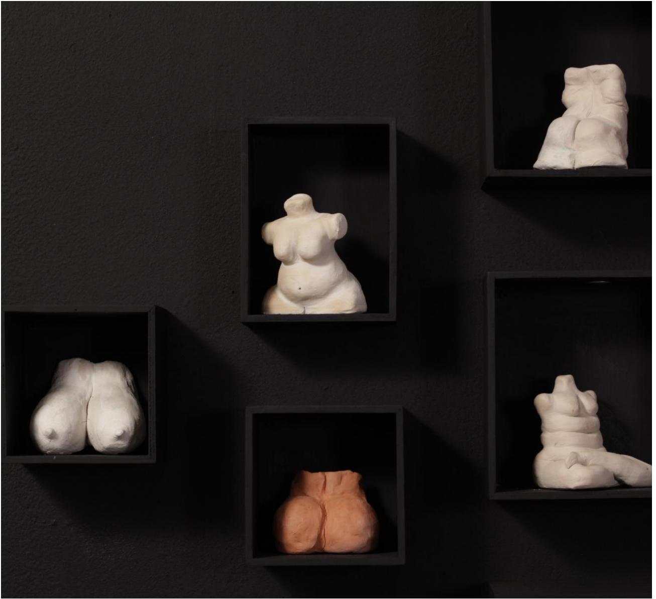
חן סרור, בצלמי, פרט, פסלי חימר ועץ