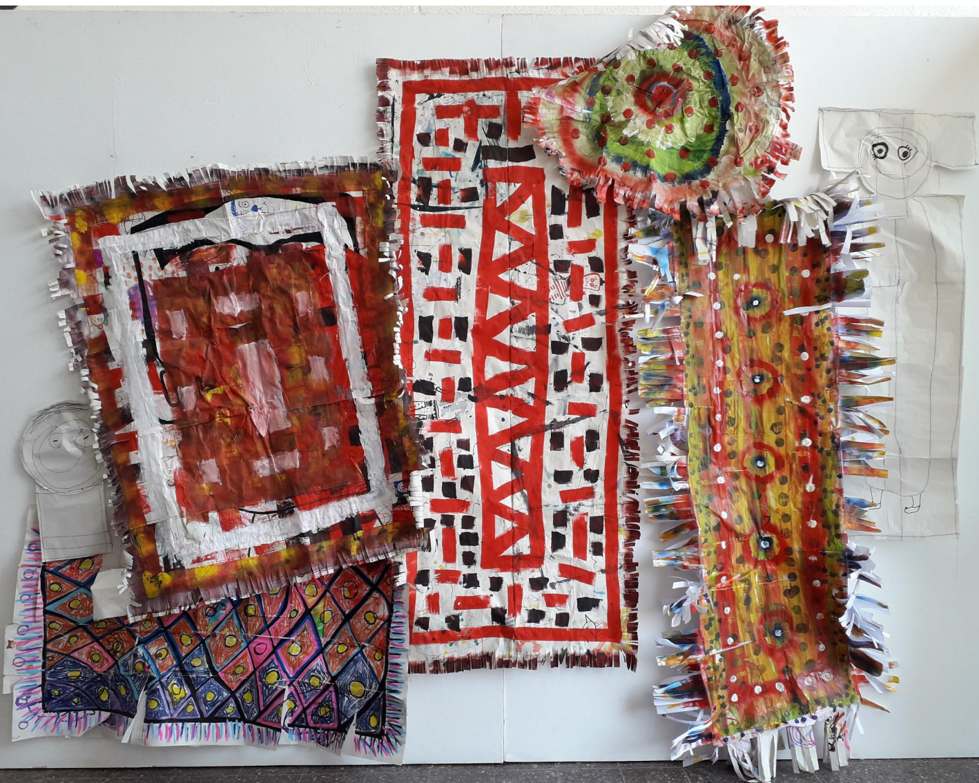
נועה מיירנץ, תובנות, טושים וצבע אקרילי על נייר