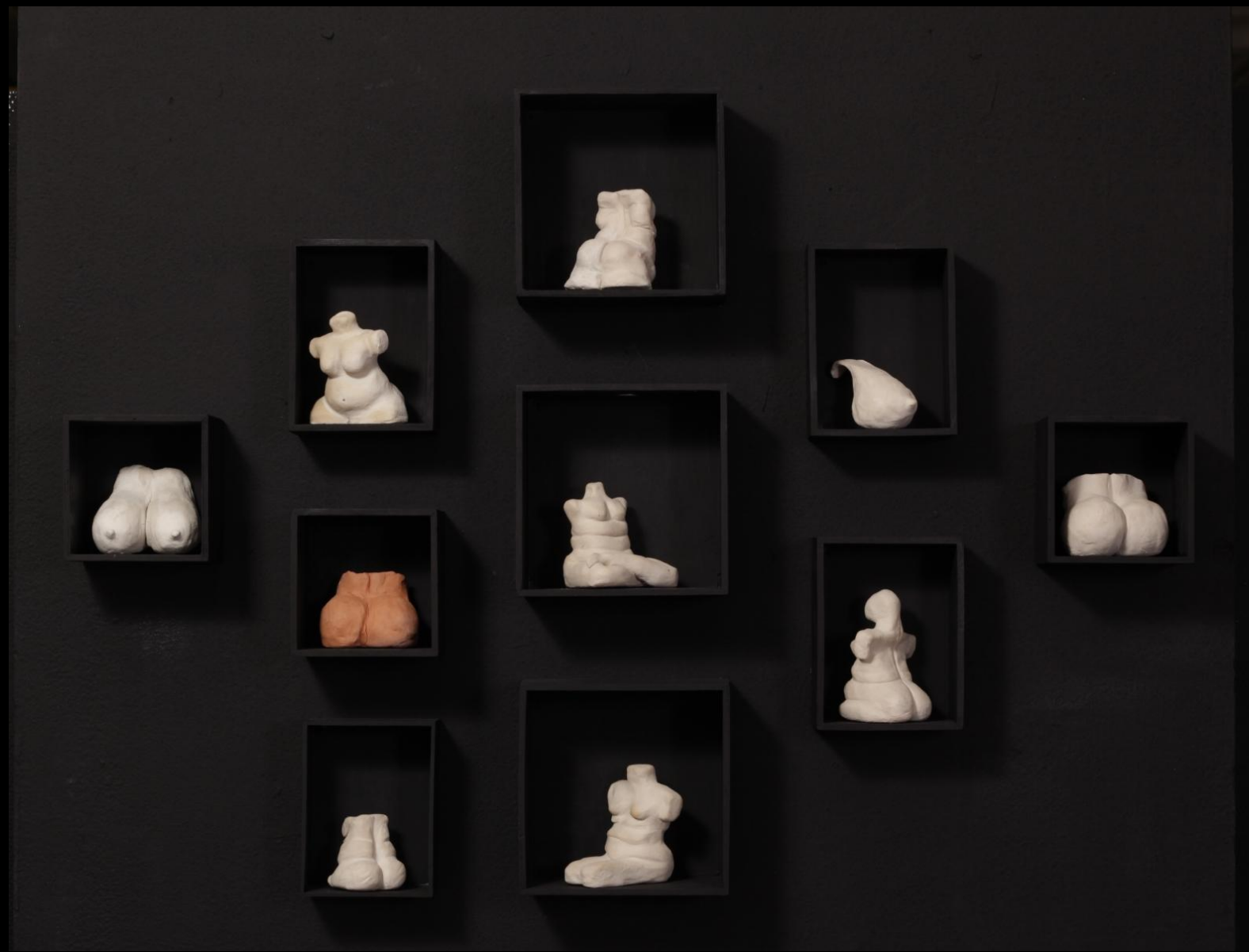
חן סרור, בצלמי, מראה הצבה, פסלי חימר ועץ