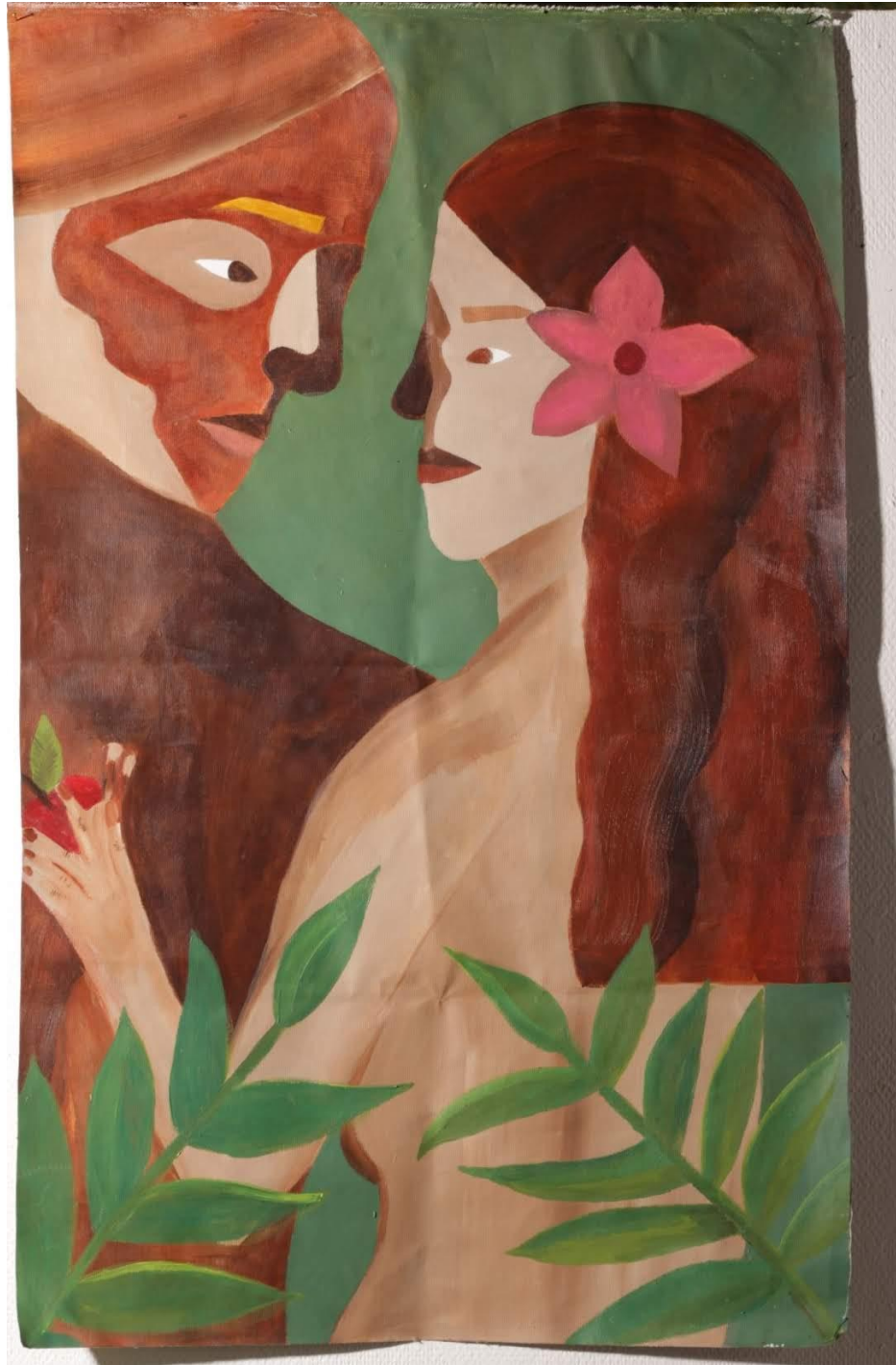
טל דיין פרץ, אדם, חווה- איש, אישה, צבע אקריליק על בד