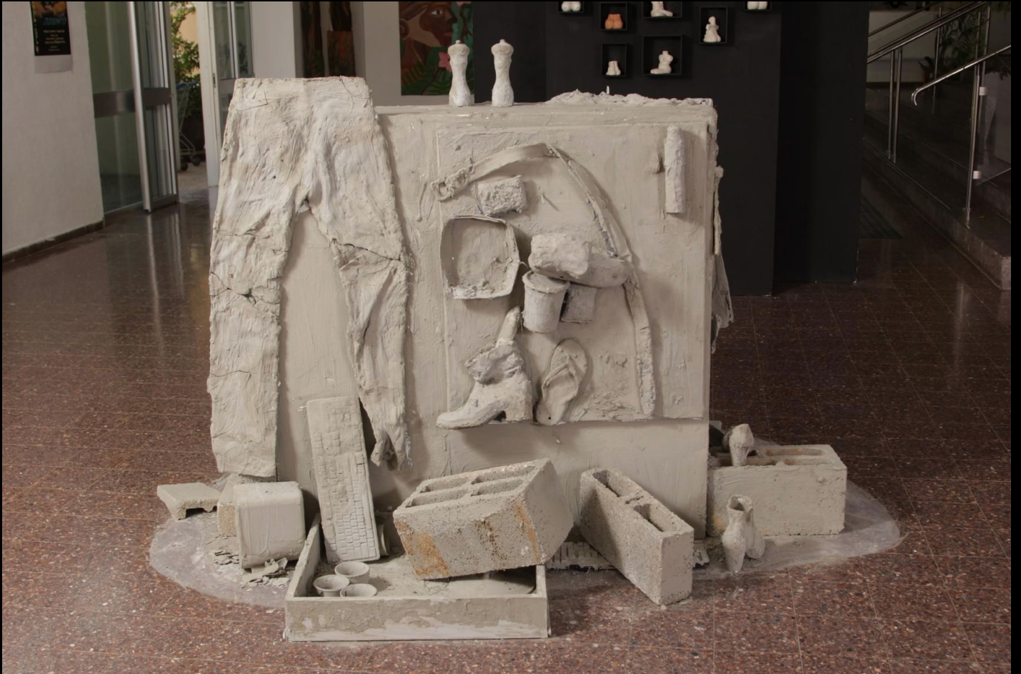
דניאל דיין עזרן, ללא כותרת, חפצים אישיים ובטון