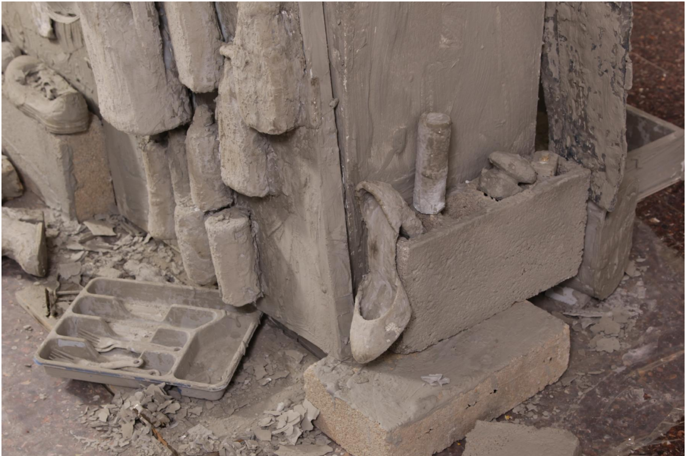
דניאל דיין עזרון, ללא כותרת, פרט מתוך מייצב, חפצים אישיים ובטון