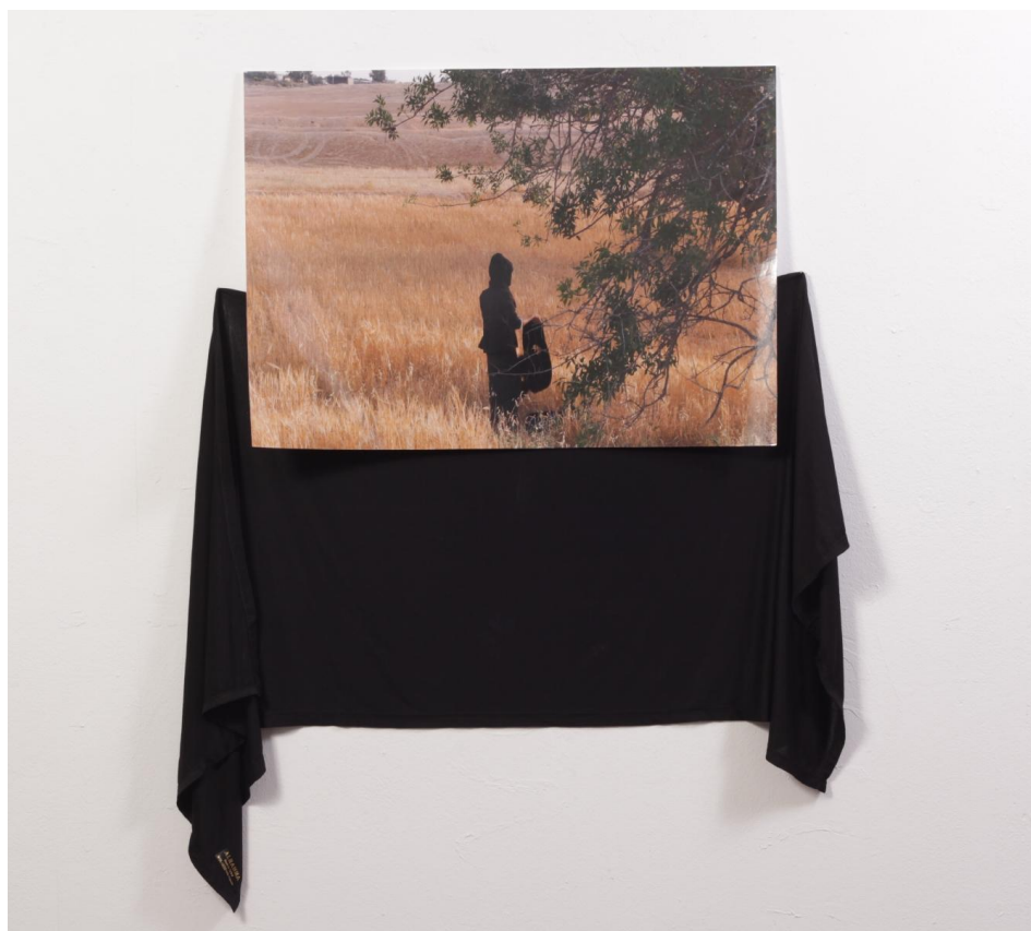
אמאני אבו קרינאת, ללא כותרת, צילום ובד