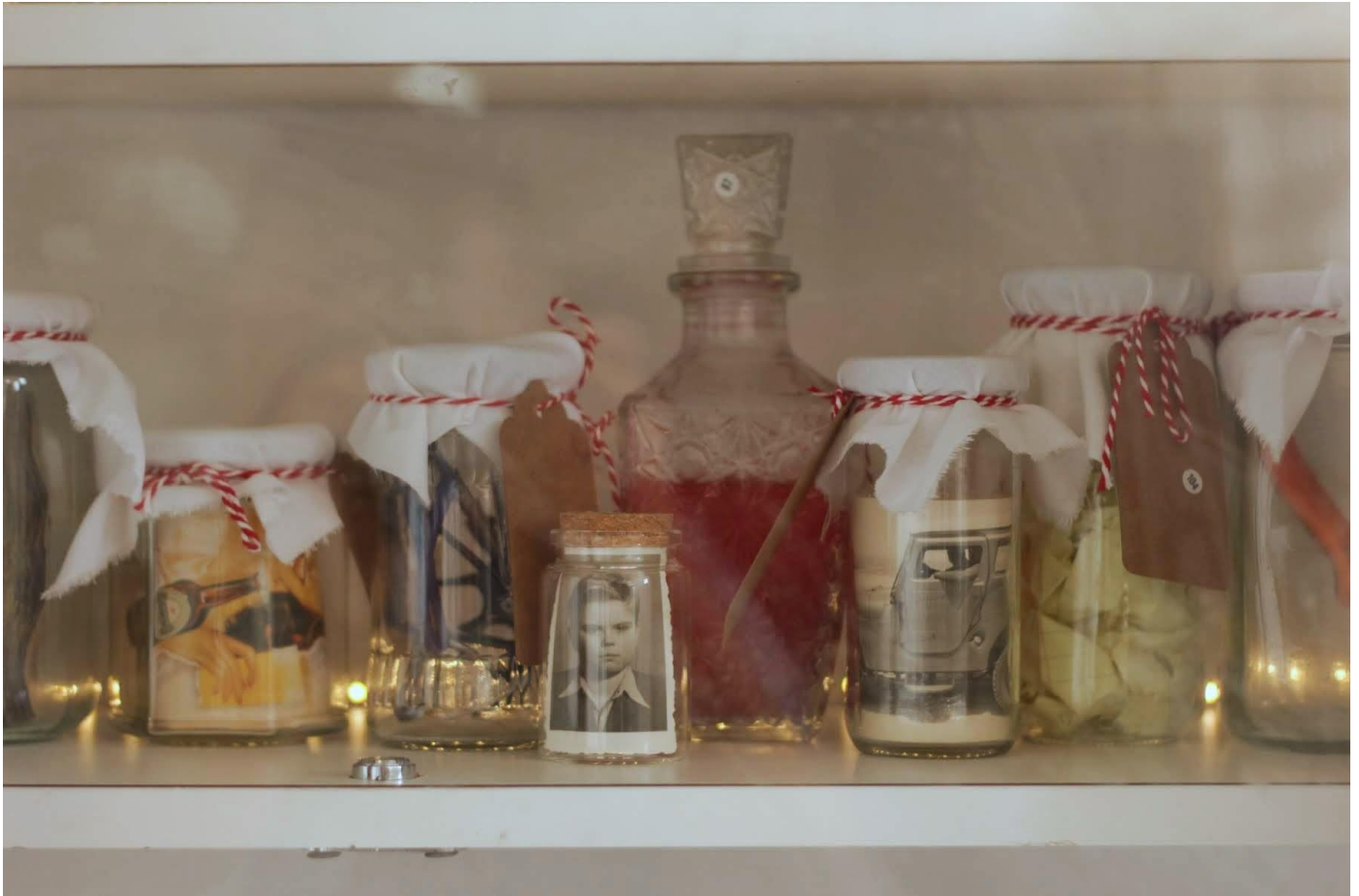
צליל אלקסלסי, המזווה, פרט מתוך מיצב כולל צנצנות, חפצים אישיים, שידה, ונורות