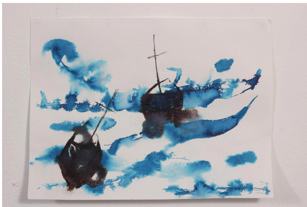
דנה קלמנסו, שליטה אל מול חוסר שליטה, אקוורל על נייר, 21*29.7 ס"מ