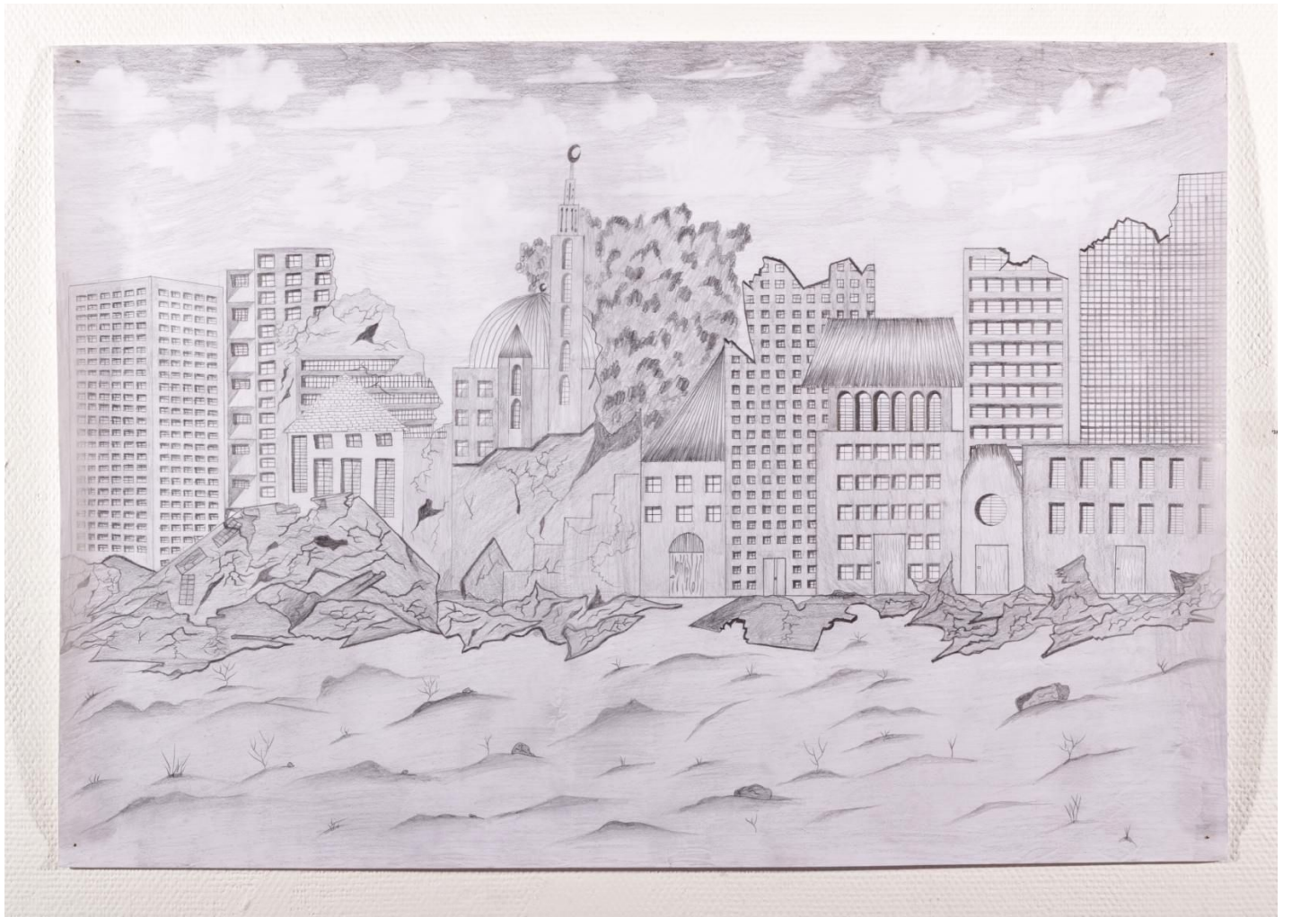
בראה אלעמראני, עפרון על נייר, 70*100 ס"מ