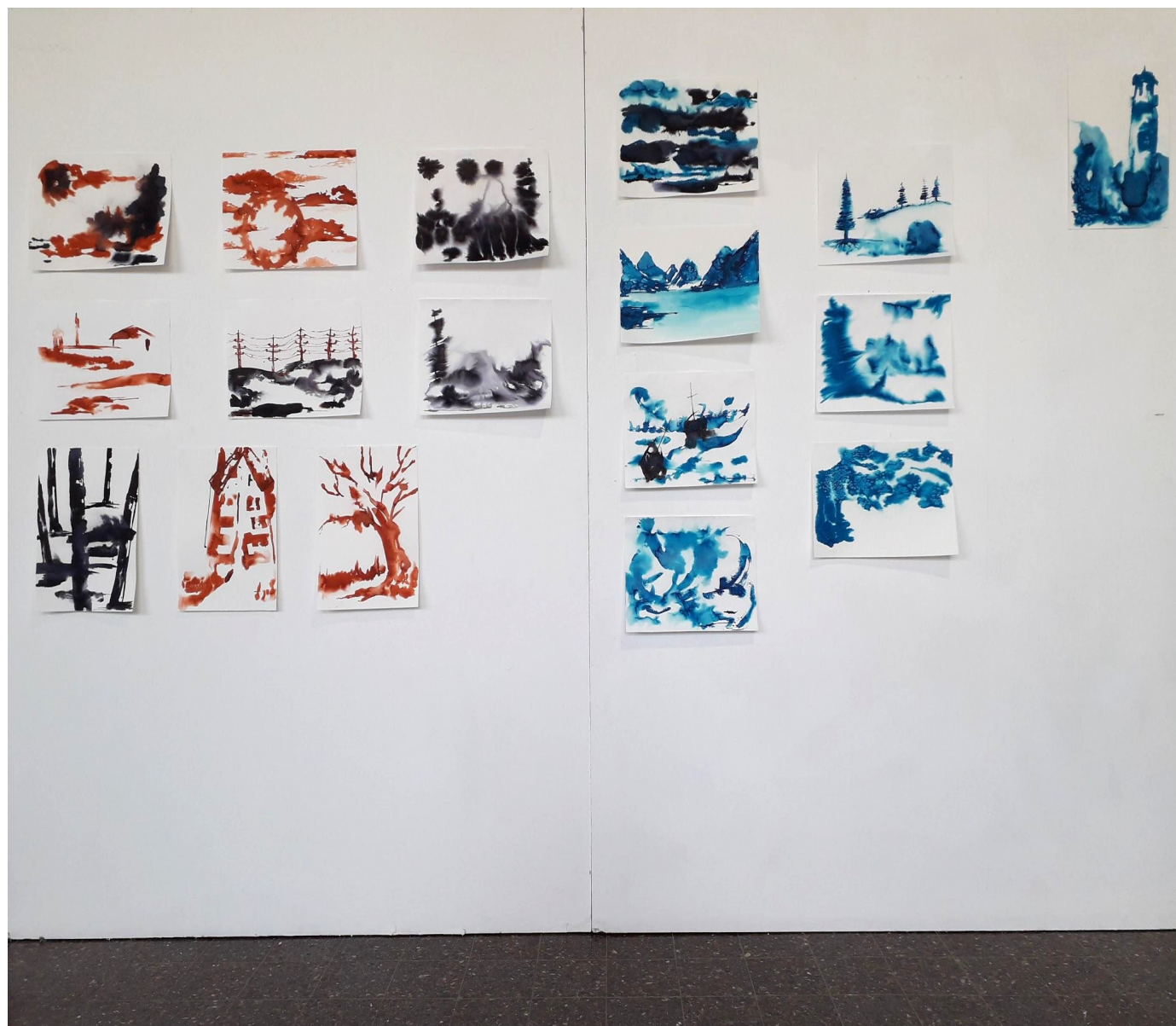
דנה קלמנסו, מראה הצבה, שליטה אל מול חוסר שליטה, אקוורל על נייר