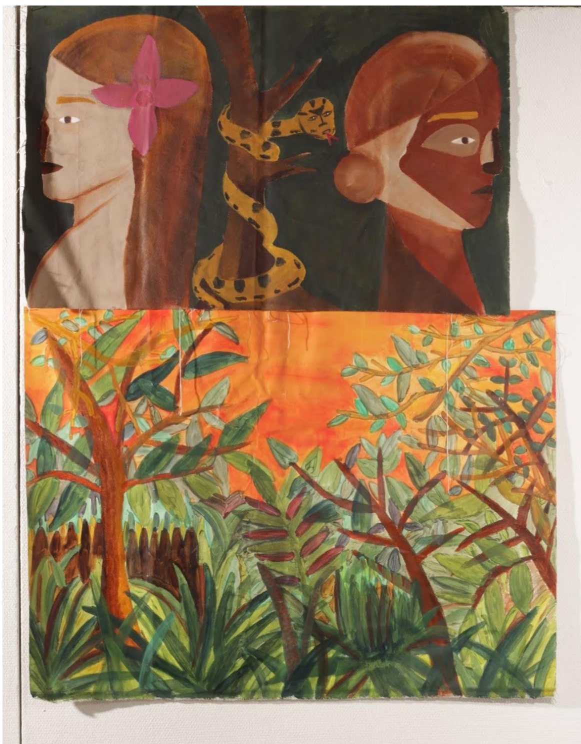
טל דיין פרץ, אדם, חווה- איש, אישה, צבע אקריליק על בד