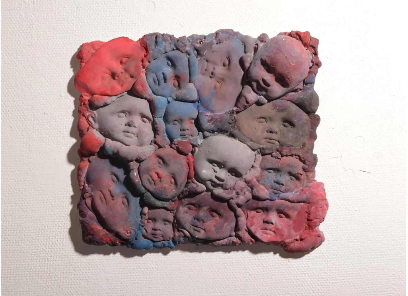
בראה אלעמראני, ללא כותרת, יציקת בטון וצבע