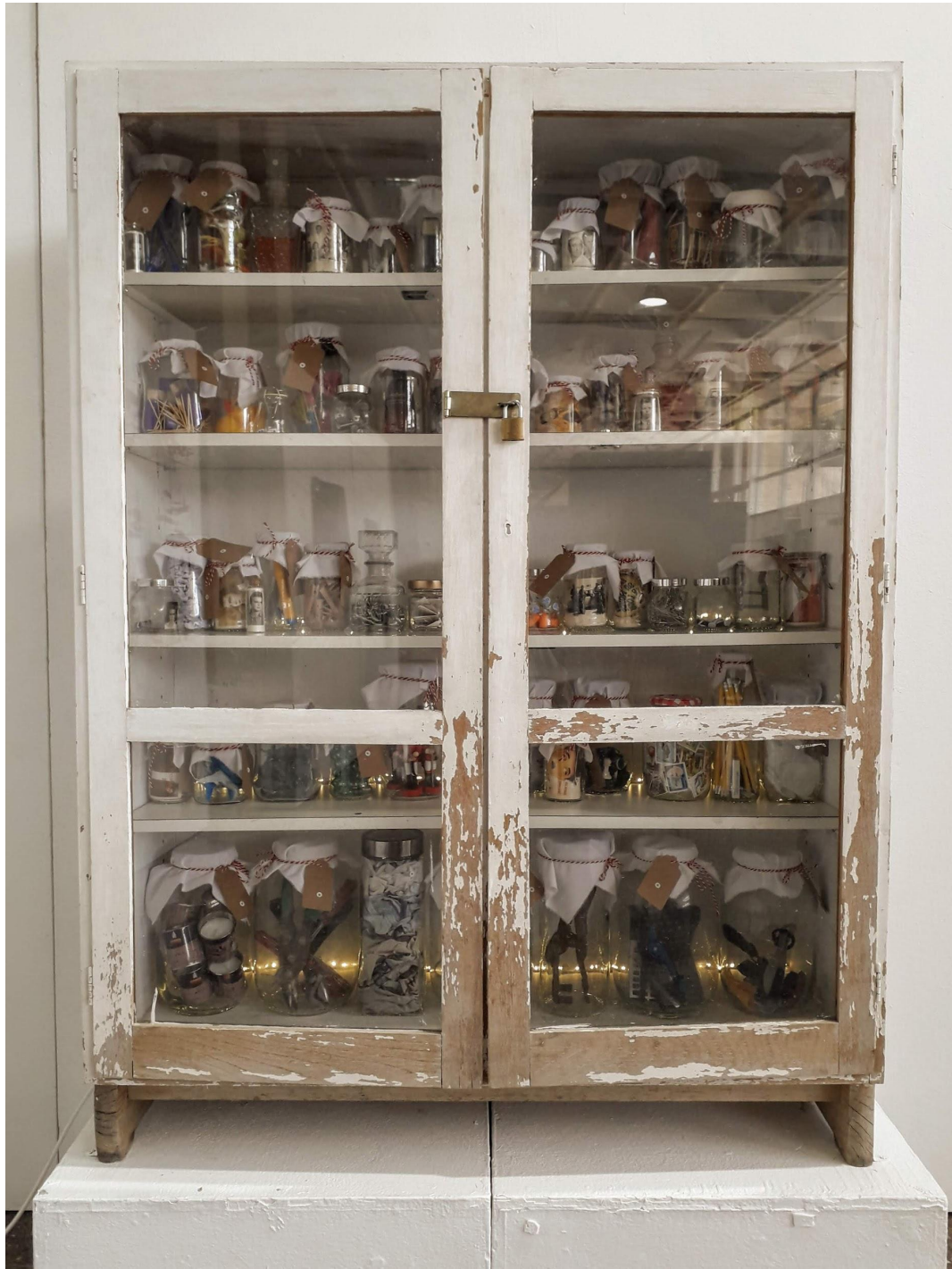
צליל אלקסלסי, המזווה, מיצב כולל צנצנות, חפצים אישיים, שידה, ונורות