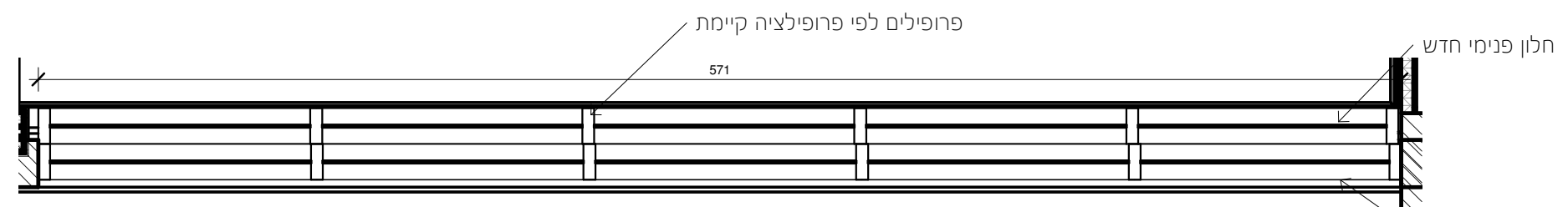
חלון פנימי חדש