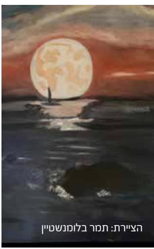
הציירת: תמר בלומנשטיין