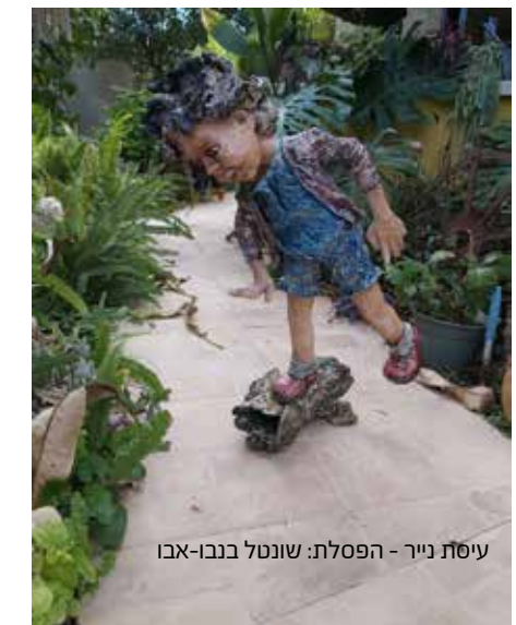
עיסת נייר - הפסלת: שונטל אברו-בנבו