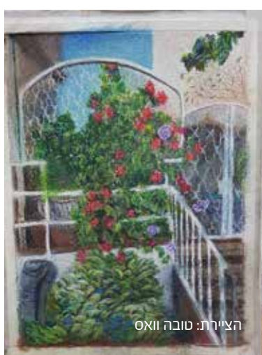
הציירת: טובה וואס