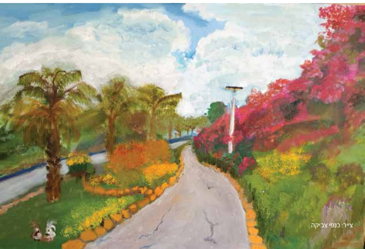
ציור: כנפי צביקה