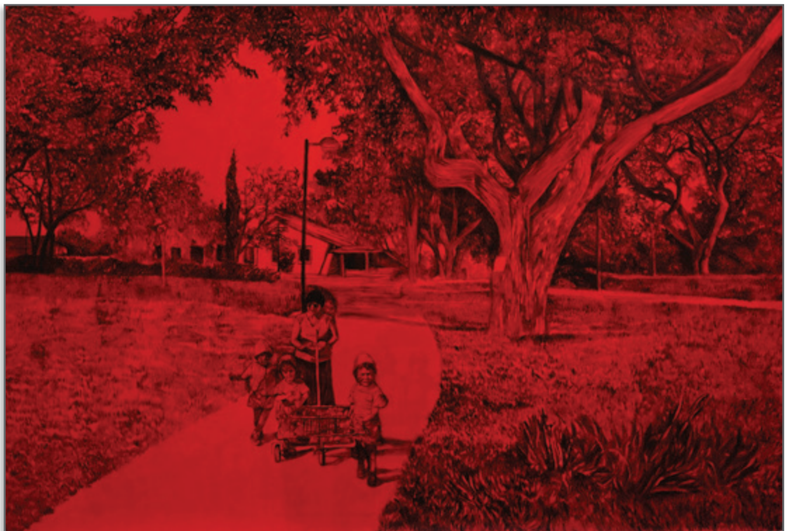
העלייה לחדר האוכל