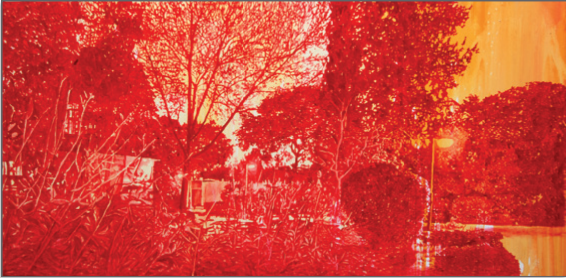
צומת פרומקין