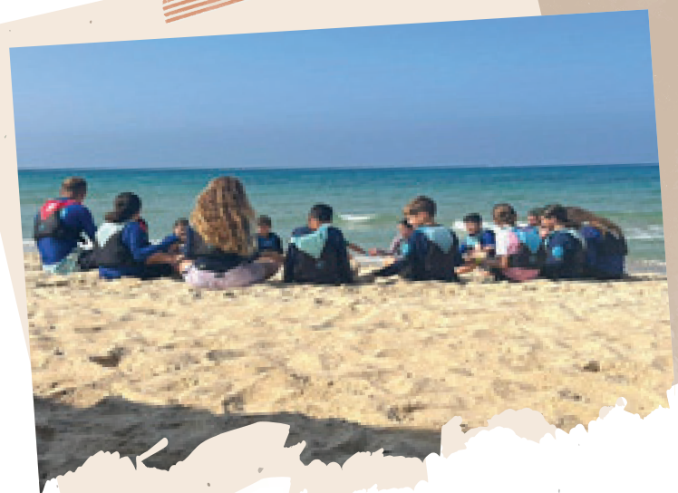
עמותת 'הגל שלי' מאמצת את ילדי כפר עזה, חינוך מבוסס מקום בים התיכון

אני מאחלת לכפר עזה ולכל עם ישראל שישובו החטופים בהקדם האפשרי, שנצליח לשמור על עצמנו. ■