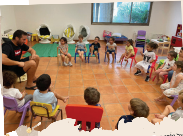
אל ילדי כפר עזה הגיעו מפעילים חיצוניים ותרומות ציוד רבות.