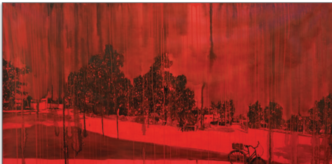
פנורמה עם אופניים.