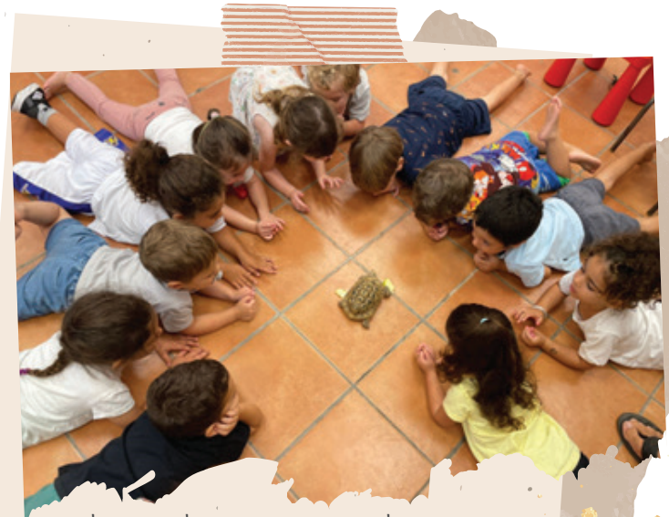
ילדי כפר עזה מתבוננים על חיה שיש לה בית על הגב.

בשבעה באוקטובר התעוררנו קצת לפני 6:30 מרעש של מטחים כבדים ואזעקות צבע אדום, תיארונו לעצמינו שיש עוד סבב. עברנו לממ"ד, בן זוגי ואני עם הילדים. להפתעתנו בחוץ היו כמויות בלתי רגילות של לחימה, פיצוצים מכל עבר, ירי, הודעות ווטסאפ של חברי הקיבוץ על מחבלים