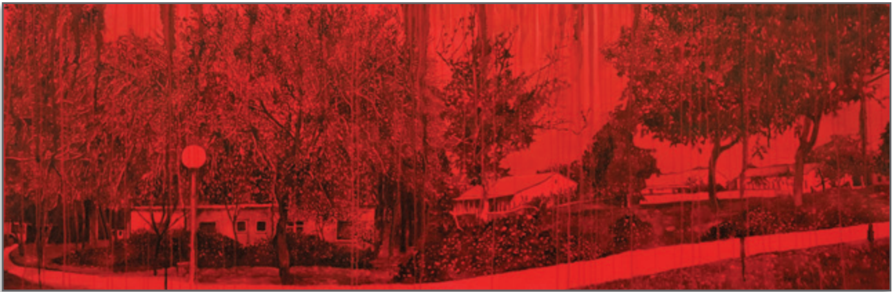
פנורמה מדרכה מאחורי המזכירות