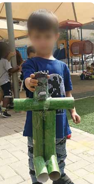
ר' עם דגם של הענק הירוק שהוא הכין עם חבר באחת הפעילויות

בעזרת תיווך של מבוגר בעבודה רצופה ומשמעותית כל ילד יכול לפרוח בגן.