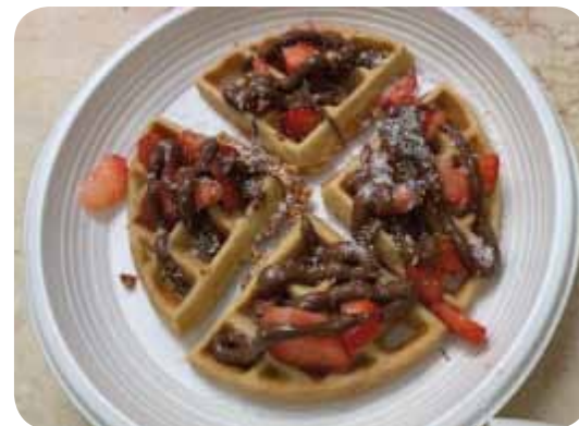
אחד מתוצרי המסעדה (המאכל האהוב על שתינו)

בעבודה שלי יחד איתה גיליתי המון דברים על עצמי ועליה ועל המקצוע של הגננת. על עצמי גיליתי שאני מסוגלת להיות אסרטיבית מול שאר הילדים, לדעת כיצד לבקש מהם לאפשר לי לעבוד רק איתה ולא להתארגן עם עבודה מול קבוצה גדולה של ילדים. פתאום גיליתי שהילדה שהייתה נראית כ"שקופה" ולא מורגשת בגן היא ילדה עם חוזקות ויכולת הבעה. היא עברה תהליך מדהים מבחינתי. היא התחילה לגשת אליי ולשתף אותי בסיטואציות